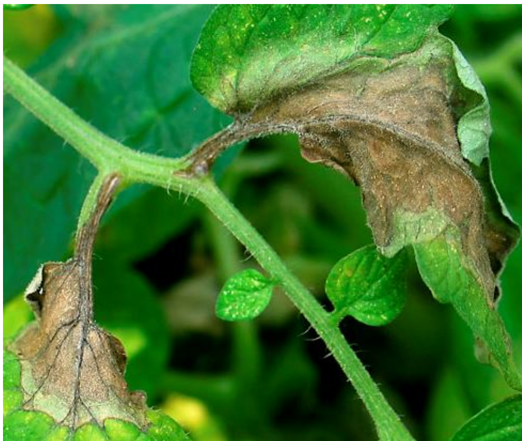
Peronospora del pomodoro