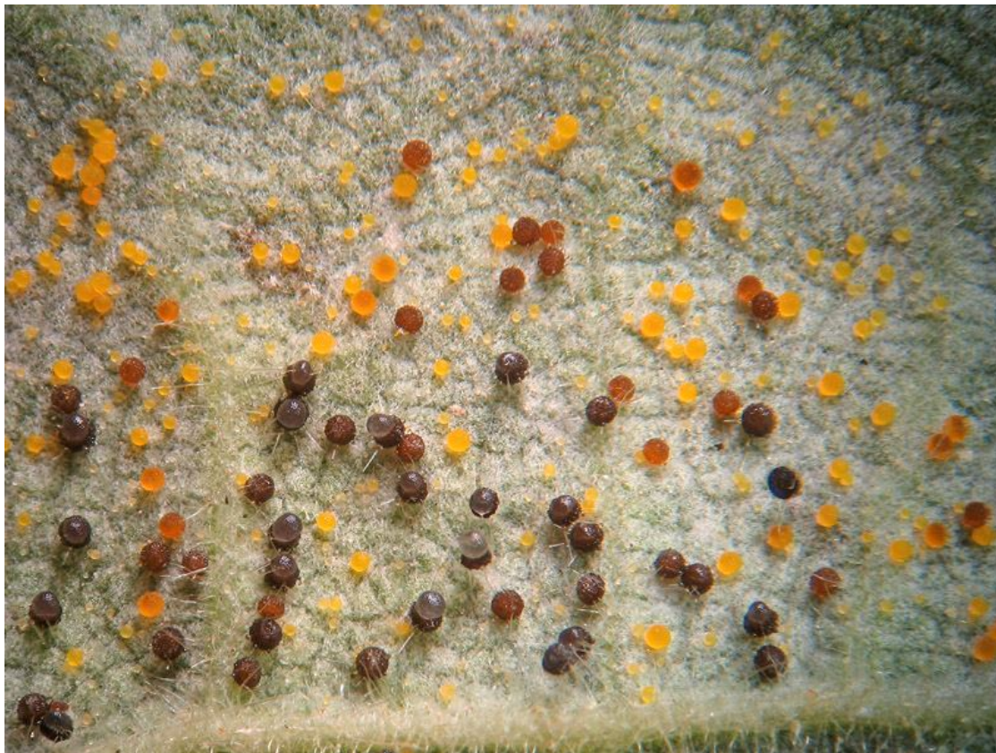
Oidio o mal bianco - Cleistoteci