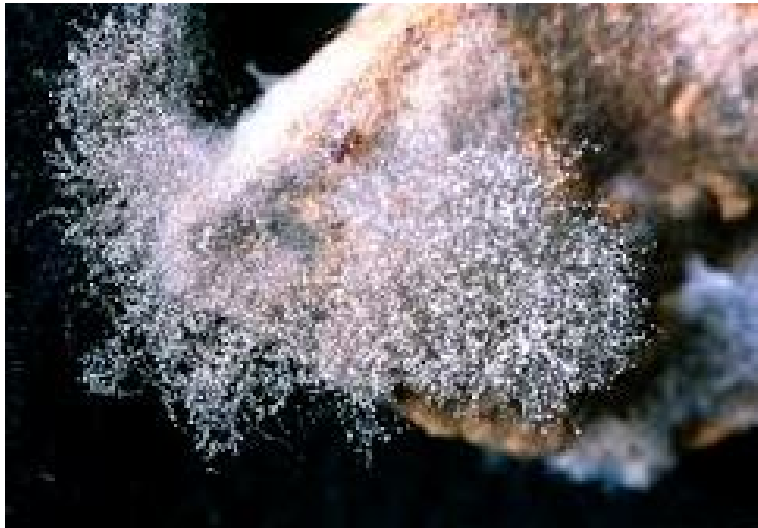
Botrite o Muffa grigia