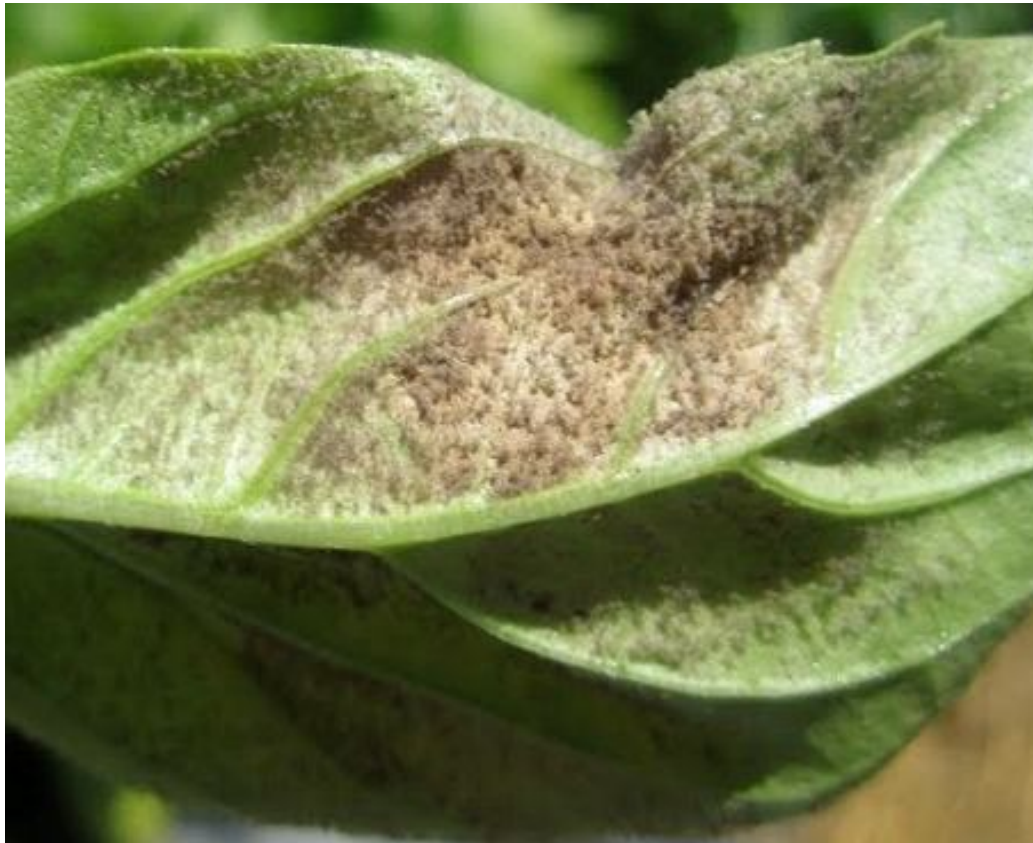
Peronospora del basilico