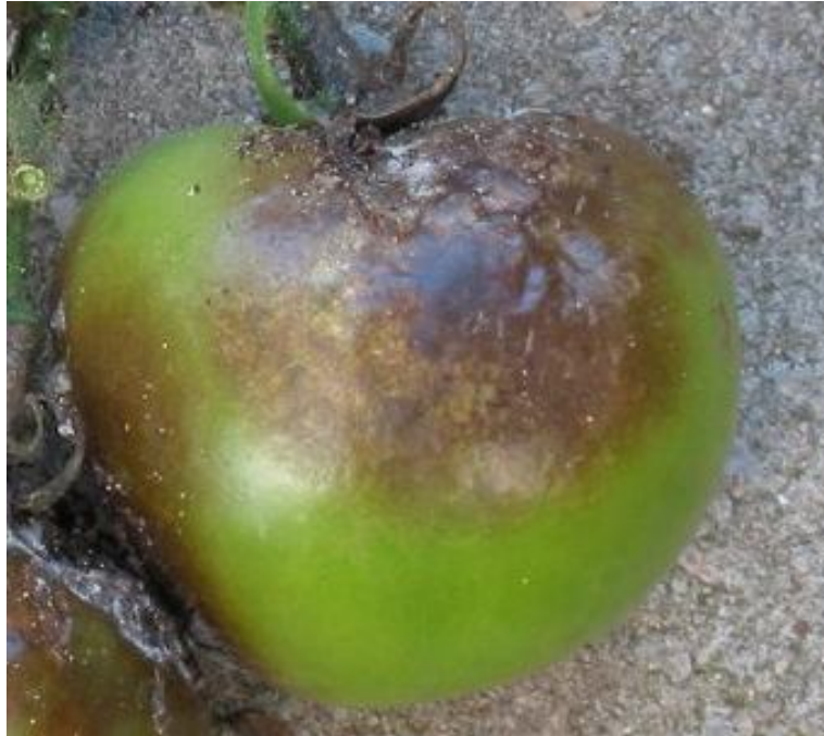
Peronospora del pomodoro