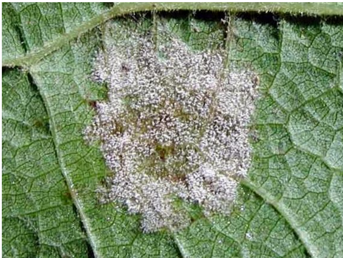
Peronospora della vite